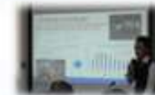
カンボジアでの中小企業開発商品紹介セミナー (JICA中小企業SDGsビジネス展開支援)

有償資金協力、無償資金協力、技術協力プロジェクト、中小企業SDGsビジネスの支援経験と知識をもつ人材を、(独)国際協力機構(JICA)やアジア開発銀行(ADB)などの国際機関へ派遣し、プロジェクトの企画、事業基本計画策定等を支援します。