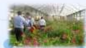
パレスチナ・ジェニンでの農業経営視察 (JICA農業調査)