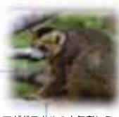
マダガスカルの人気者レミュー (JICA地方教育行政評価調査)