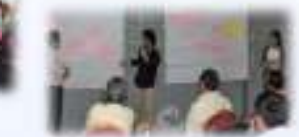
カモス教育財団の方々と協働型ワークショップ (ADB ICT in Secondary Education)