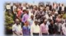
国際開発事業に絡むモザンビークの 国家公務員への研修プログラム (JICA 円借款実施促進業務)