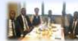
能力強化セミナーに参加したモザンビーク中央銀行の役員とJICA 円借款実施促進業務員

米国PMIのPMBOK®による研修講師を務め、クライアント政府関係者が担う投資事業のマネジメントや調達業務の能力強化を図ります。(独)国際協力機構(JICA)による政府開発援助(ODA)調達ガイドラインおよび国際コンサルティング・エンジニア連盟(FIDIC)調達マニュアル双方についての知識を共有し、技術実践のための助言を提供します。