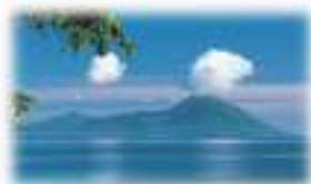
パプアニューギニアの美しい火山の島ラバウル (JICA経済インフラ・社会基盤調査)