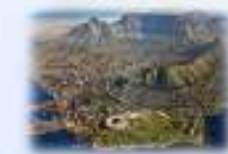
壮大な姿を見せる南アのケープタウン (JICA水資源・上水道調査)