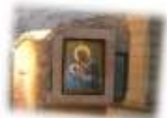
ベツレヘムで聖母子画(母乳の聖母)を拝観 (JICA観光開発調査)

米国 プロジェクト・マネジメント・インスティテュート (PMI) 障害分野NGO連絡会 (JANNET) (賛助会員) 日本社会福祉士会 (JACSW) 通訳技能向上センター(CAIS) ※法人所属とスタッフ所属の両方を記載しています。